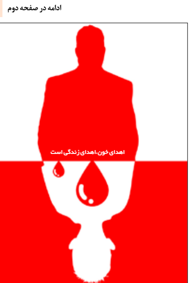
اهدای خون، اهدای زندگی است

« در جریان مسایل ارباب و رعیتی در دهه ۳۰ و ۴۰؛ دکتر مرتضوی و پدر ارجمند ایشان رفتار انسانی با روستاییان داشتند و مردمان روستا،